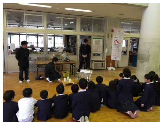
2月24日 出前授業 (機械科)