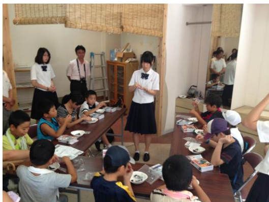
8月6日 (ソーラーカー作成)