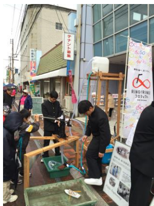
師走市での開店（12月13日）