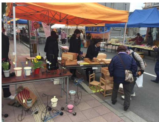
初市での開店（3月1日）