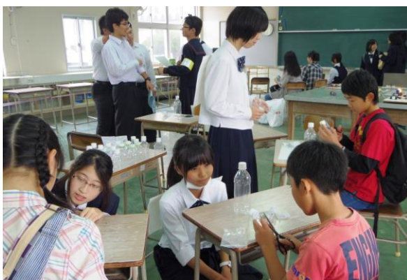
11月1日 親子ものづくり教室 (電子科)

11月の文化祭で、親子ものづくり教室を、2月に加治木町内の4つの小学校で出前授業を行いました。